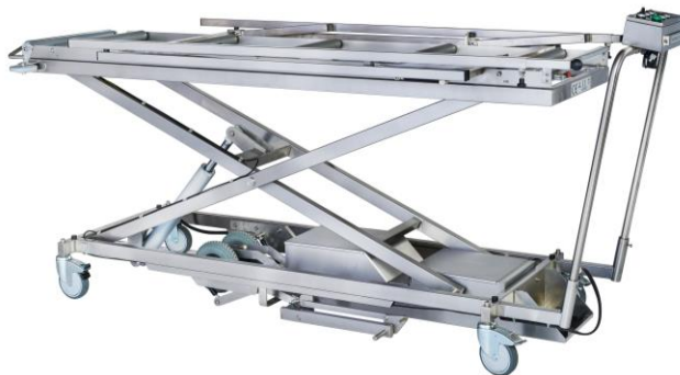
Hub- und Transportwagen mit Antriebsrolle MTR-RB 24V sowie Fahrantrieb FAT-HTW-24