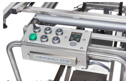
Steuerungseinheit mit vorwärts/rückwärts Tasten

An allen Hub- und Transportwagen der Serie HTW 50/51xxx kann an der Standard Rollbahn eine zusätzliche elektrische Antriebsrolle angebaut werden, um Leichenmulden automatisch in die Regaleinrichtungen einzufahren. Die Steuerung erfolgt über ein Bedienfeld mit 2 Tasten „Vorwärts / Rückwärts“. Die Energieversorgung erfolgt über eine eingebaute Batterie.