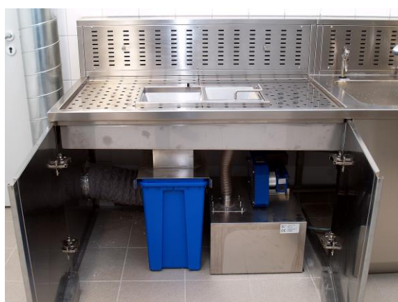
Abfallbehälter für Feststoffe / 60 Liter Tank mit Altformalinpumpe mit automatischem Pumpsystem (Individuelllösung)