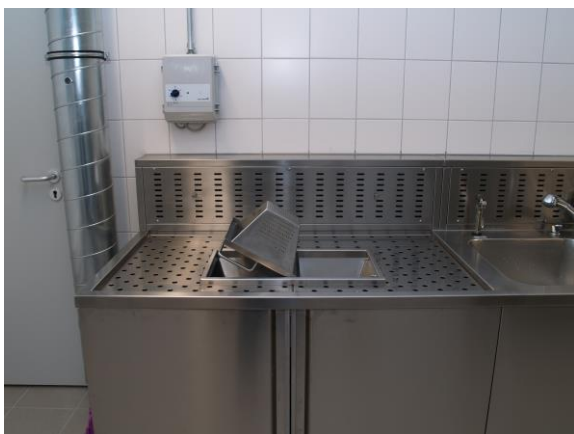
Trennsieb zum Abscheiden von Feststoffen und Formalin