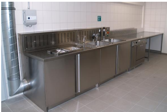
Individuelllösung mit Doppelwaschbecken, Desinfektionsautomat und Arbeitstisch