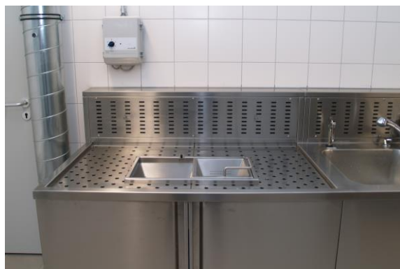
Entsorgungsstation mit Trennsieb sowie Luftabsaugung nach Hinten und unten