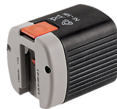
Ersatzakku für Autopsiesäge Artikel-Nr. 020.010.295 Typ: EA-HB-740

KUGEL Medizintechnik Vertriebs GmbH Hermann-Köhl-Str. 2A DE – 93049 Regensburg