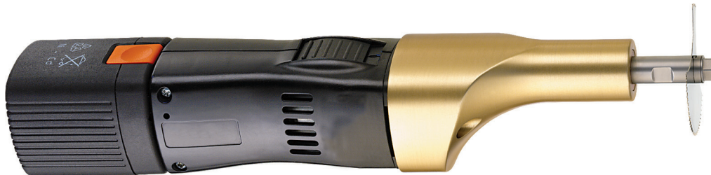
Autopsiesäge HB 740-Akku

Die oszillierende Autopsiesäge mit auswechselbaren Sägeblättern wird mit einem Akku geliefert. Durch den Wegfall des lästigen Netzkabels ist die Säge ideal für den mobilen Einsatz geeignet und unabhängig vom Stromnetz. Der Sägekopf ist mit Druckausgleichsbohrungen versehen. Zum Sterilisieren kann der Sägekopf daher abgebaut werden.