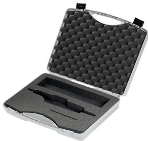
Kunststoffkoffer für Autopsiesäge HB 740-Akku Artikel-Nr. 020.010.232 Typ: K-HB-740-Akku